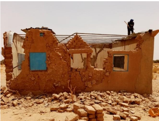
Une salle de classe dégradée à Tchicolanène, après les pluies

Comme tout le Sahel, le Niger et l’Aïr en particulier ont connu des précipitations très importantes et des inondations catastrophiques au mois d’août 2020.