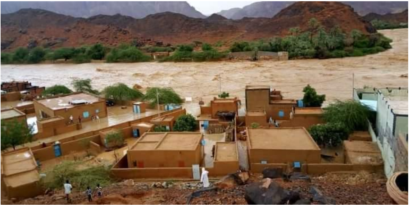
Crue à Timia