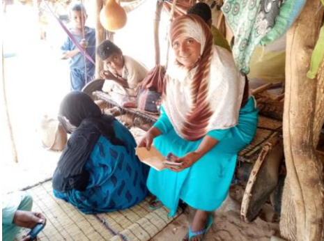
Trésorière du COGES de Tchicolanène recevant l'aide N'Mitaf

À Tchicolanène et à Séloufiet, comme partout au Niger, les cours ont repris au début de juin 2020, après un arrêt lié à la pandémie de Covid-19. Ils se sont poursuivis jusqu'au 15 juillet, date des vacances. La nouvelle année scolaire a débuté au mois d'octobre.