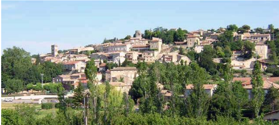
(Le village d'Alex)

Maison St Joseph, 4 Montée La Butte – Alex